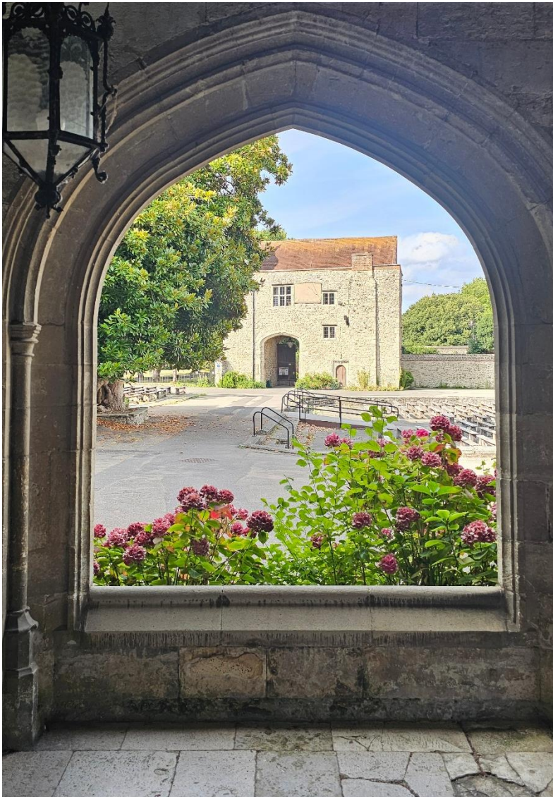
The Friars Aylesford Priory England (Kloster Innenhof)