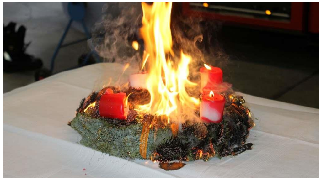
Die umgekippte Kerze (links) sorgte dafür, dass das Engelshaar Feuer fing, und einige Sekunden später brannte der ganze Kranz

Rauchmelder in der Wohnung können zudem das Risiko einer unbemerkten Brandausbreitung mindern.