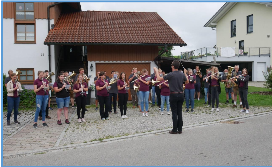
Wanderndes Standkonzert durch´s Dorf mit unseren neuen T-Shirts

Erfreulicherweise konnten wir aber trotzdem eine ganze Schar an Jugendlichen gewinnen, die ein Instrument erlernen wollen.