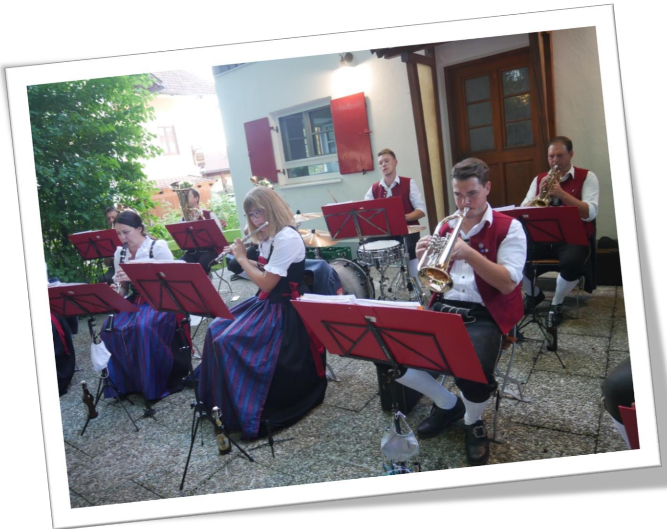
Biergarten spielen beim Felderwirt

Nachdem sich auch in der zweiten Jahreshälfte alles um das Thema Corona drehte, war es aus Sicht der Musikkapelle ein recht ruhiges Jahr. Außer dem „ wandernden Standkonzert “ mit verschiedenen Stationen in Kraftisried, „ Biergarten spielen beim Felderwirt “ und die „ musikalische Umrahmung eines Gottesdienstes “ für verstorbene Musiker in der Pfarrkirche Unterthingau, musste alles Geplante leider abgesagt werden